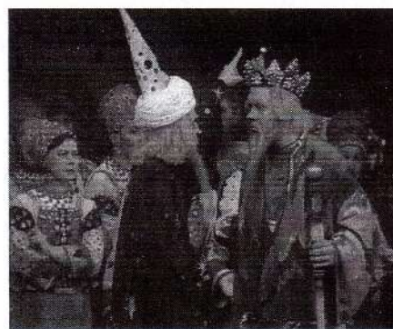
2. Композитор Н.А. Римский-Корсаков