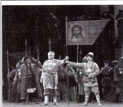
1. Композитор А. П. Бородин

2. Рассмотрите изображения. Какие виды искусства на них представлены?