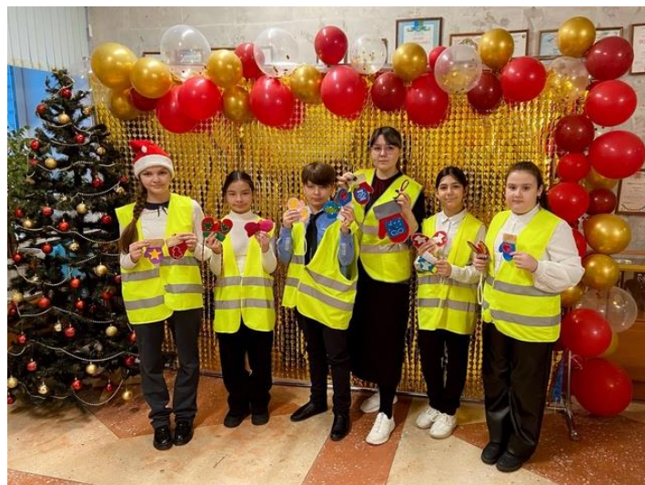
Мастер - класс «С Новым годом!» Изготовление праздничной ёлочки провели активисты Школьной Думы