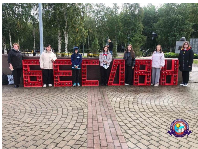
Юные жуковцы 29 школы 3 сентября, приняли участие в общегородском митинге

Память о событиях в Беслане должна служить нам уроком и напоминанием о важности борьбы с терроризмом во всех его проявлениях.