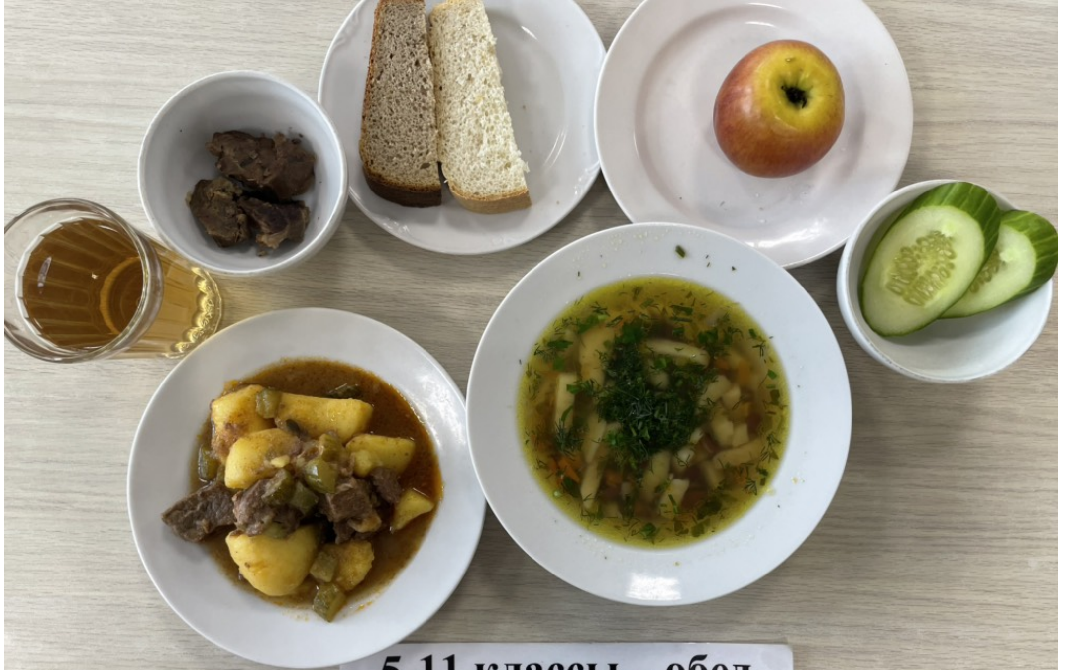
5-11 классы – обед для учащихся льготной категории