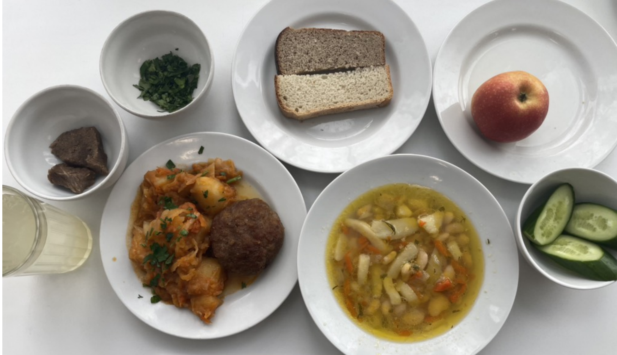
5-11 классы – обед для учащихся льготной категории