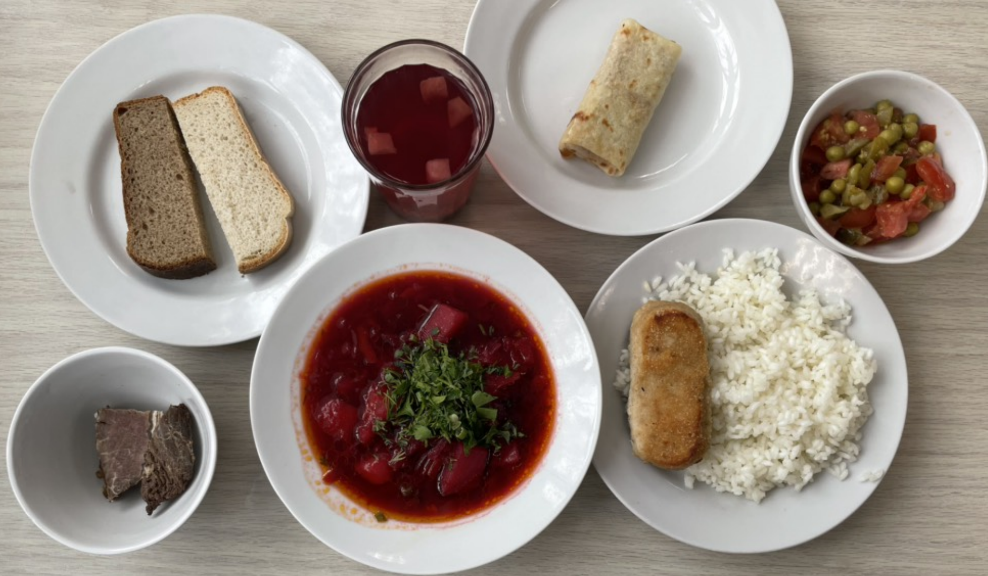
1-4 классы – обед для учащихся льготной категории