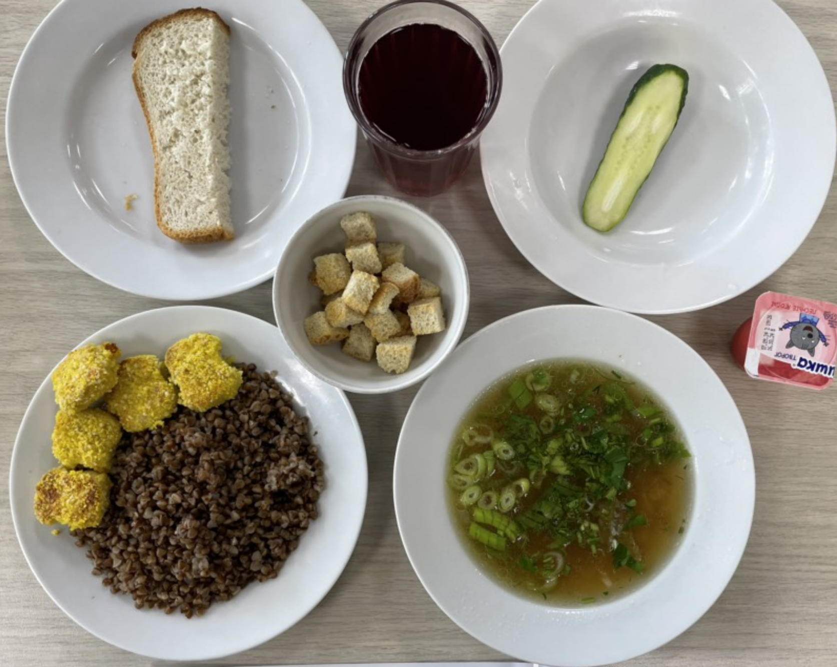
5-11 классы – обед за родительскую плату