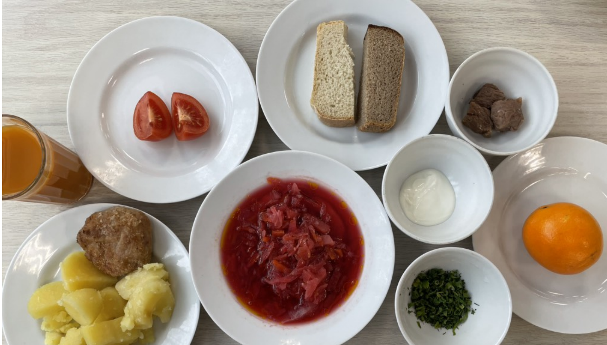
1-4 классы – обед для учащихся льготной категории