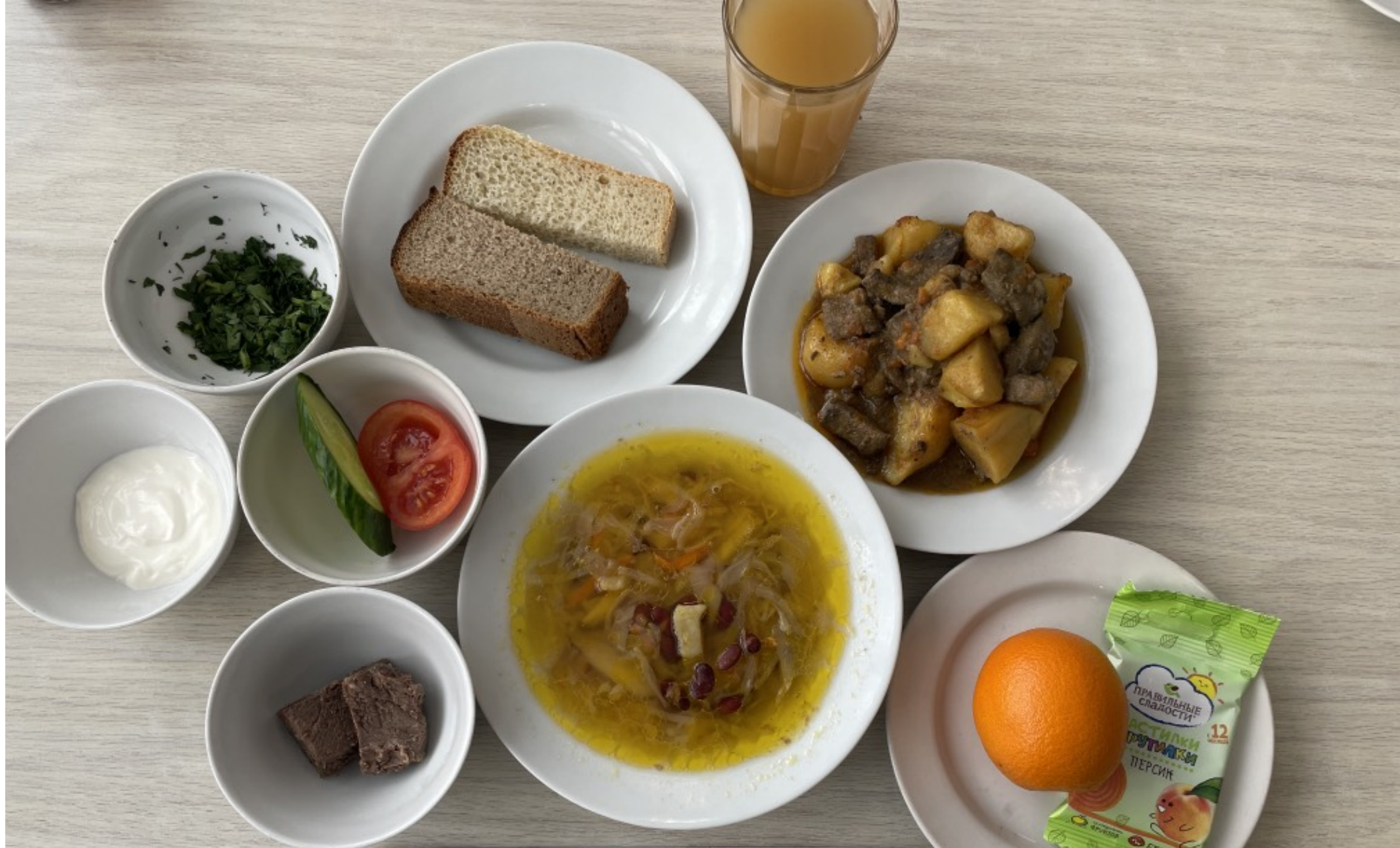
5-11 классы – обед для учащихся льготной категории