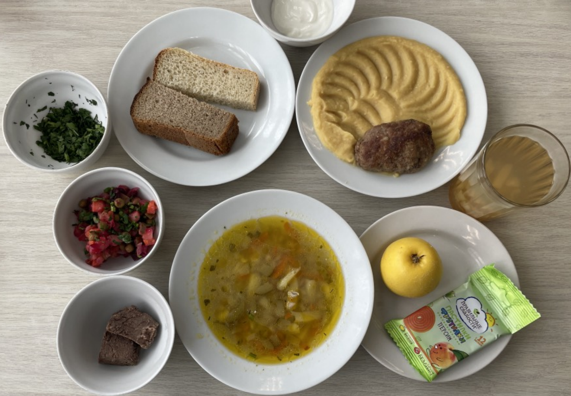
1-4 классы – обед для учащихся льготной категории