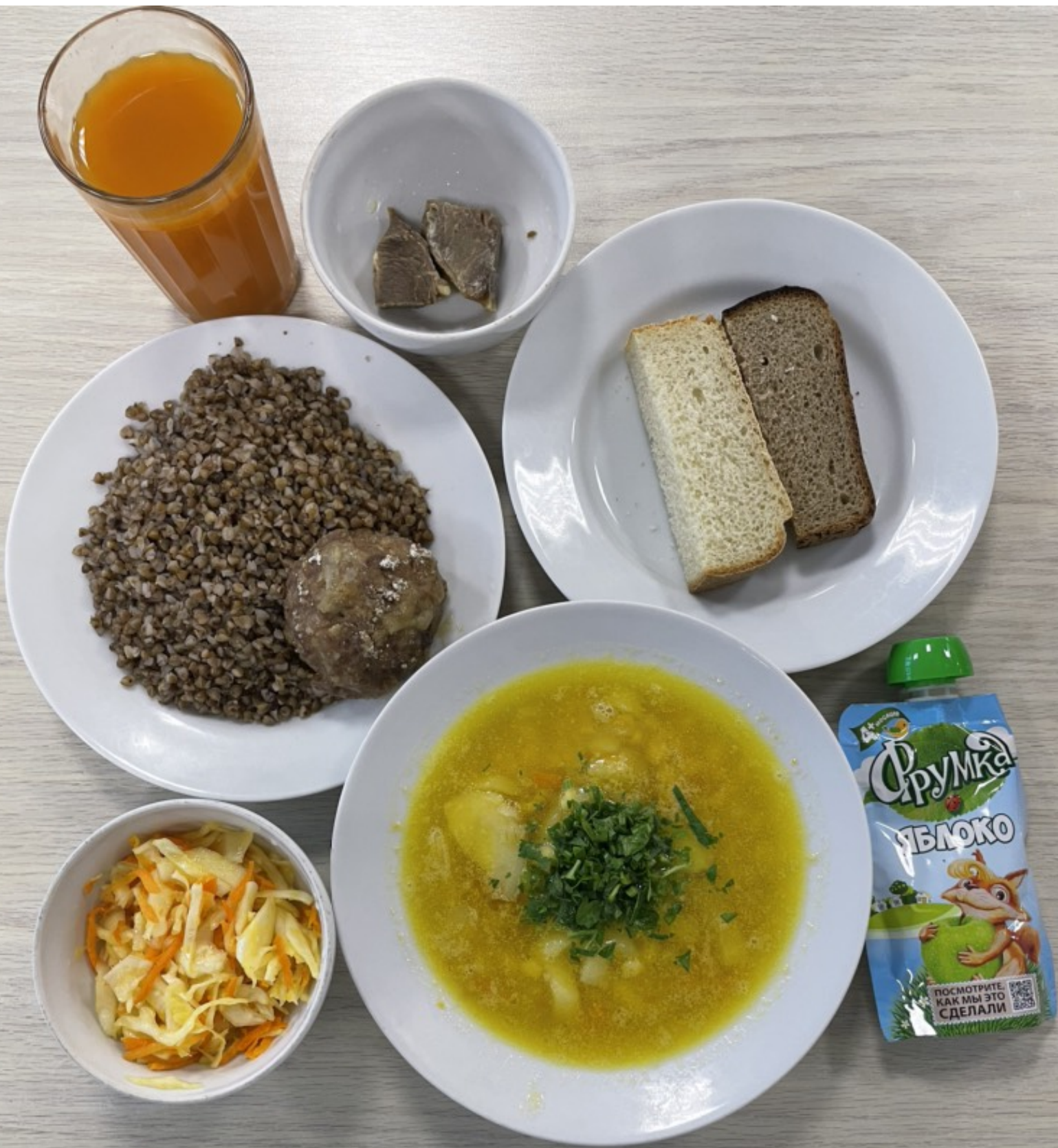
1-4 классы – обед для учащихся льготной категории