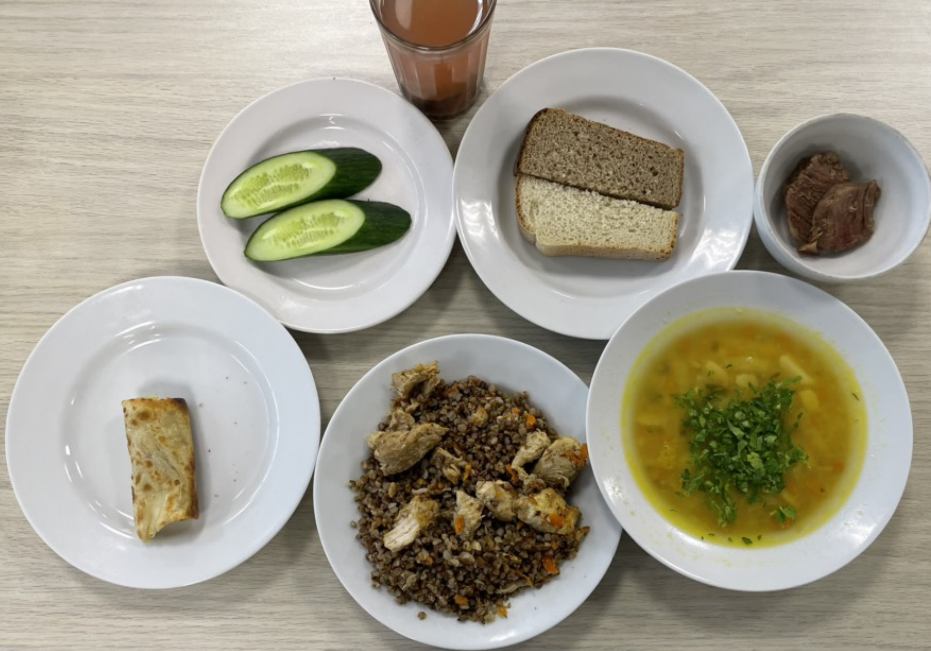
1-4 классы – обед для учащихся льготной категории