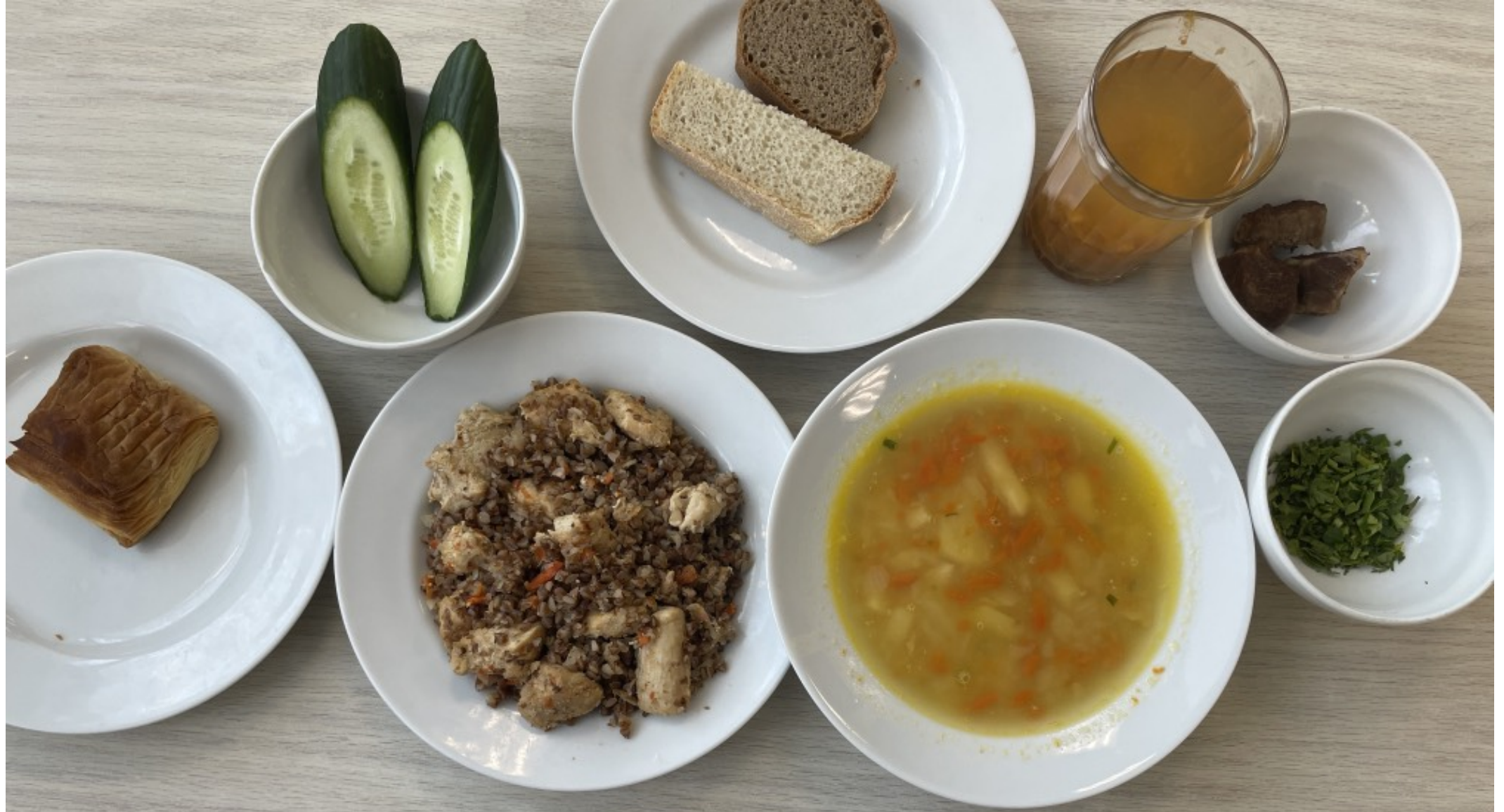
1-4 классы – обед для учащихся льготной категории