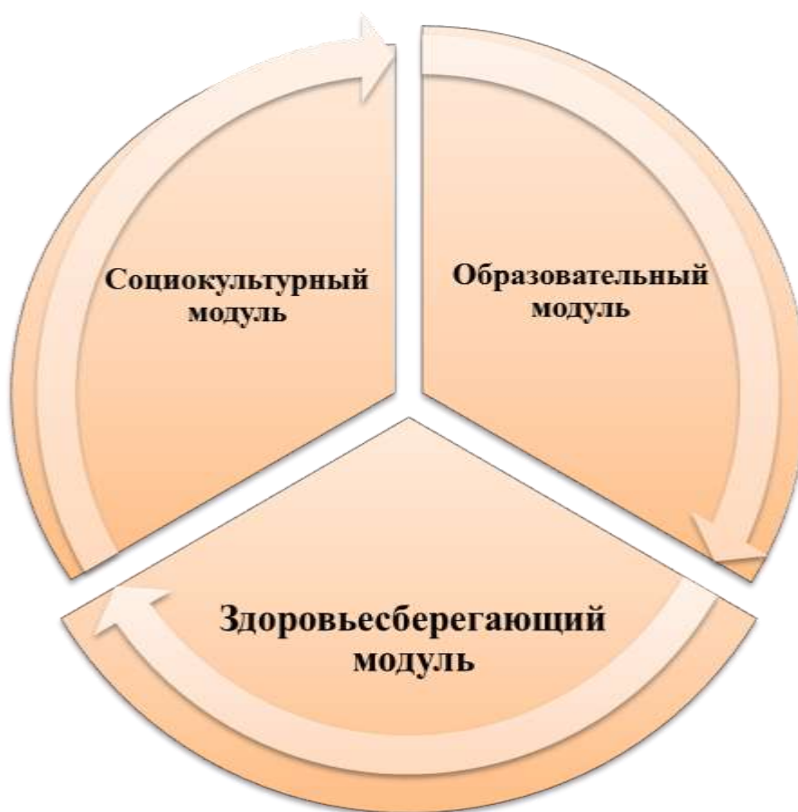
Рис.1 – Структура взаимосвязи модулей программы

Структура взаимосвязи модулей программы представлена на рис. 1.